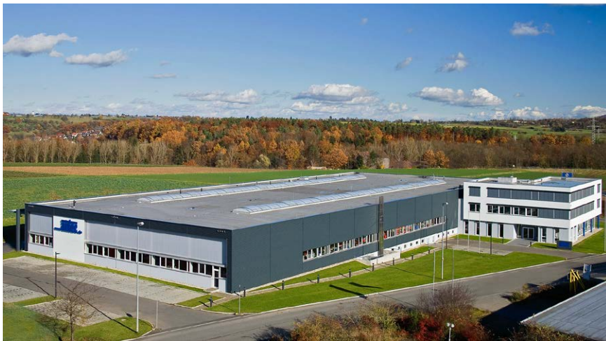
Le «Technology Center» de la maison mère Airtec Pneumatics GmbH, à Reutlingen près de Stuttgart.

Nous nous fournissons principalement en Europe via des partenaires situés en Allemagne et en Italie. Les produits de haute qualité que nous commercialisons font l'objet d'audits et d'un suivi rigoureux assurant une fiabilité irréprochable (organismes officiels TÜV-DEKRA et notre service d'assurance-qualité doté des meilleures technologies).