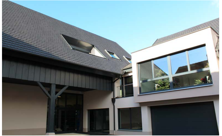
Les locaux d'AIRTEC France, situés à OBENHEIM près de STRASBOURG.

Notre vocation est d'apporter à notre clientèle des solutions personnalisées adaptées à leurs besoins en leur fournissant des produits de haute qualité . Pour cela, nous proposons des composants et des solutions « clé en main » capables d'améliorer et de fiabiliser vos installations pneumatiques. Vous retrouverez notamment des gammes de vérins, distributeurs, raccords ainsi que tous les éléments nécessaires pour le traitement d'air et la transmission par le vide.