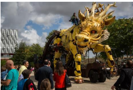
Long Ma©Emmanuel Bourgeau