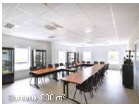
Bureaux, 800 m 2