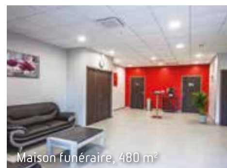
Maison funéraire, 480 m 2