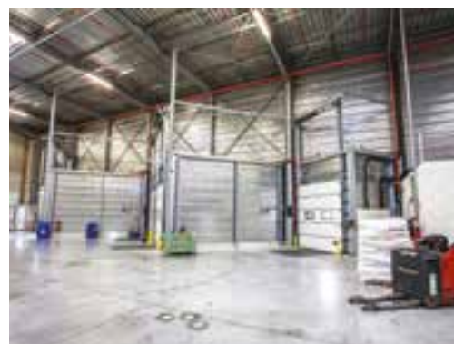
Site logistique, 4000 m 2