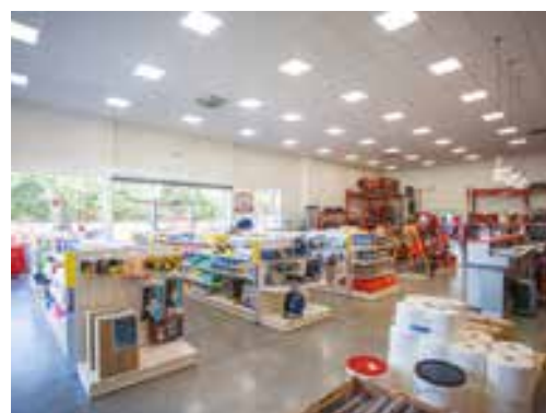
Surface de vente, 1353 m 2