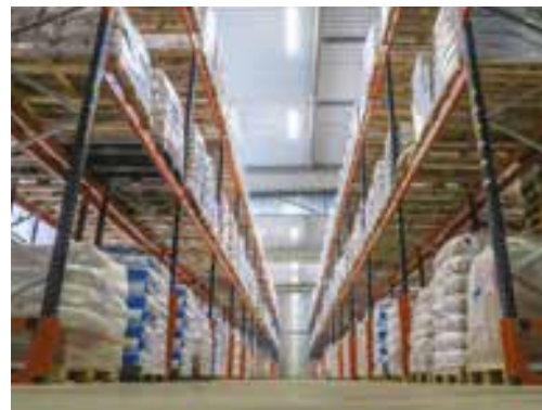
Entrepôt de stockage, 7535 m 2