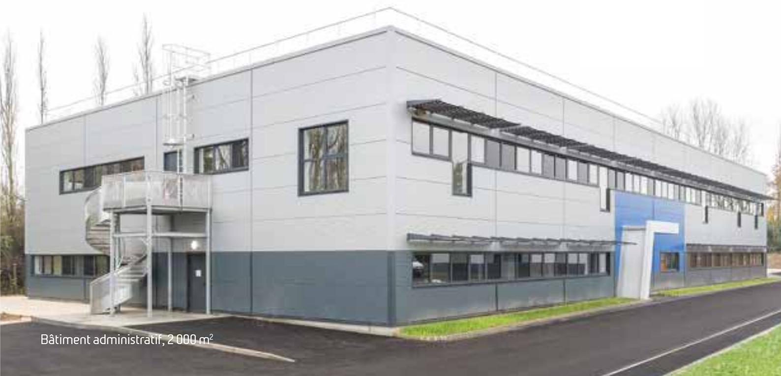
Bâtiment administratif, 2 000 m 2