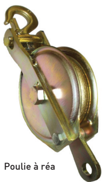
Poulie à réa