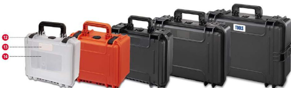
RCPS 180 à 350