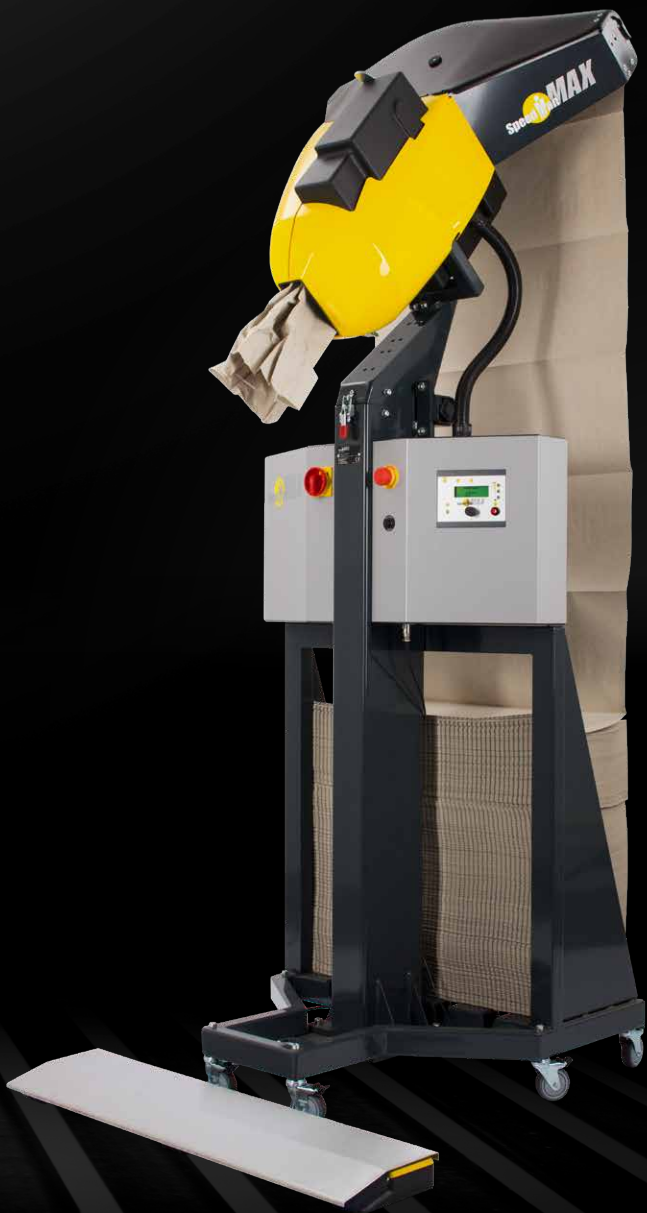
SpeedMan® MAX avec support pour pile de papier ComPackt®