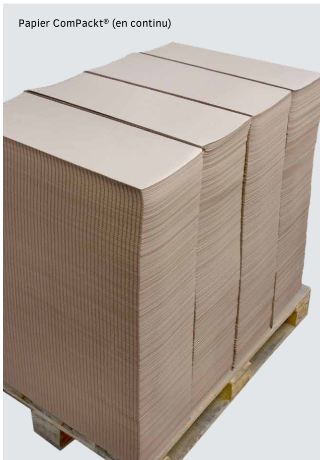
Papier ComPackt® (en continu)