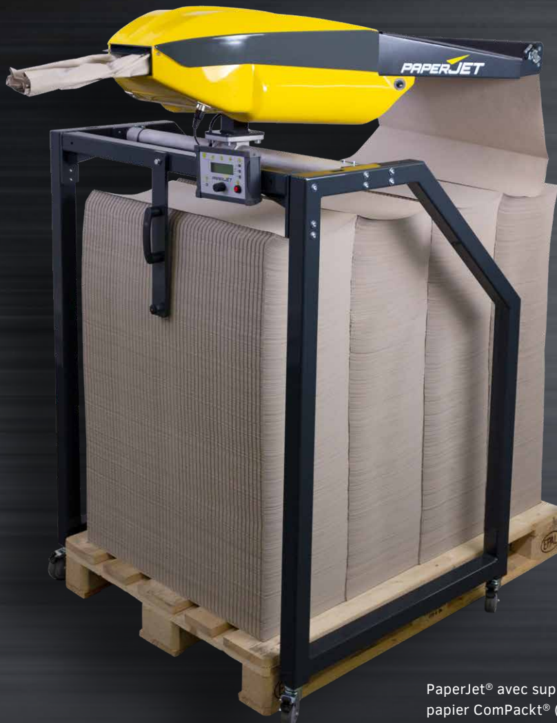
PaperJet ® avec support EUPAL et papier ComPackt ® (en continu)