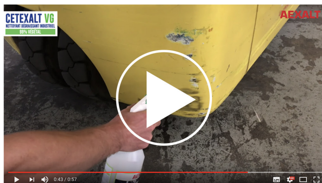
CETEXALT VG - Dégraissant industriel polyvalent concentré 99% végétal

Notre environnement c'est vous ! Visionnez la vidéo de présentation : www.youtube.com/watch?v=fbpxUvFRx6k