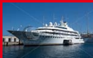
Protection des structures de navires en acier, aluminium et matériaux composites.