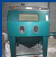
Cabine de Microbillage