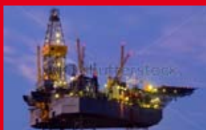
Béton et briques pour la pétrochimie