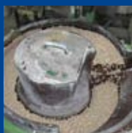
Vibrateurs circulaires ou linéaires.

Ébavurage, microbillage, ragréage, ajustage brossage et polissage sur des pièces de toutes matières et de toutes formes, du prototype à la série industrielle.