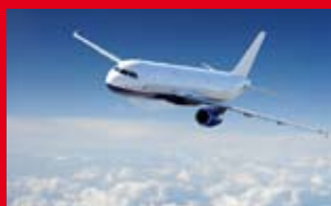
Isolation des outils de production en aéronautique

Isolation industrielle, réfection de fours, remplacement de l'amiante ou des fibres céramiques, protection incendie, dans les domaines aéronautique, naval ou terrestre. Notre gamme est l'une des plus complètes du marché : elle s'étend de la fibre en vrac aux produits prêts à poser, de 0,5 à 200mm d'épaisseur, du produit souple aux panneaux autoportants.